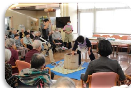
介護ロボット HAL は餅つきでも大活躍。