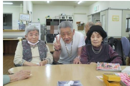
愛泉苑に入所した後も友人と交流が続き喜ばれています。

編集後記：新年度が始まりました。今年度は介護・医務・給食・相談部門の合同の目標として、「ご利用者様の希望を叶えよう」を掲げています。ご家族様の協力なくしては叶えられない希望もあると思います。ご協力をお願いする事もあるかと思いますがご理解頂ければ幸いです。今年度も楽しく生活が送れますよう支援していきます。