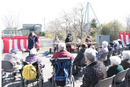
4月に行われた大正琴を招いた花見行事の様子です。

具体的にはデイサービスに友人、知人がいらしている時に一緒にレクリエーション活動に参加させて頂いています。